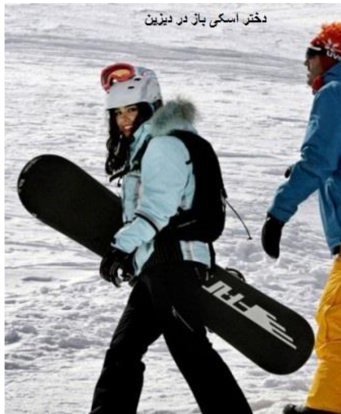
دختر اسکی باز در دیزین