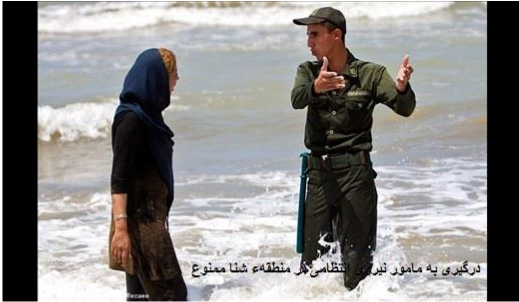
درگیری به مامور نیروی انتظامی در منطقه شنا ممنوع