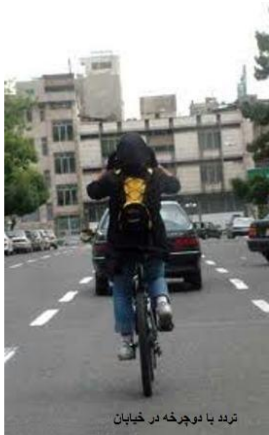
تردد با دوچرخه در خیابان