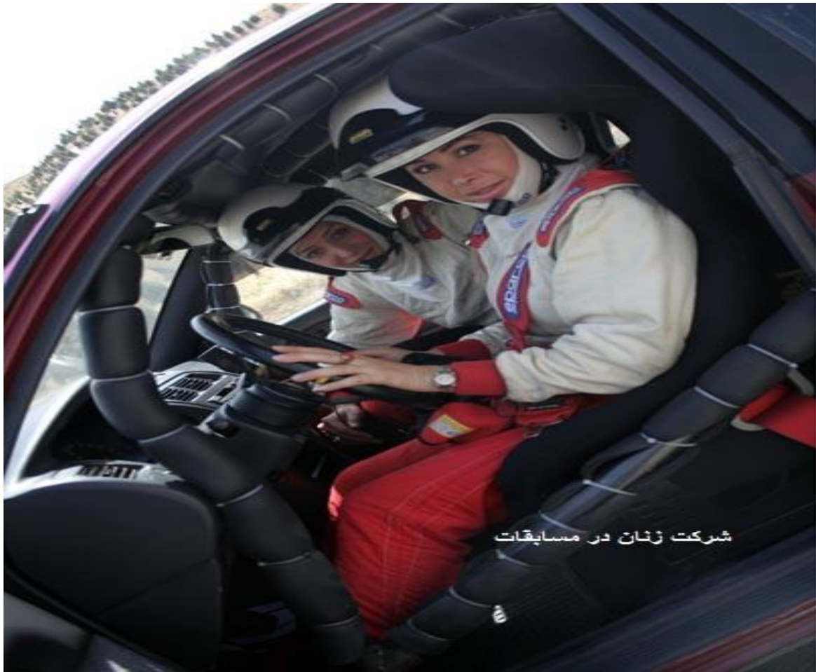
شرکت زنان در مسابقات