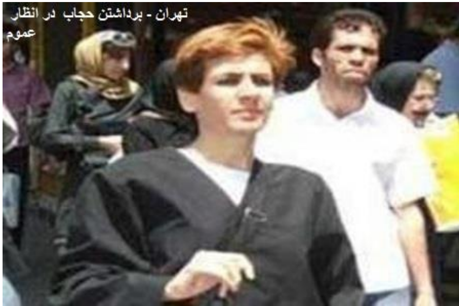
تهران - برداشتن حجاب در انظار عموم