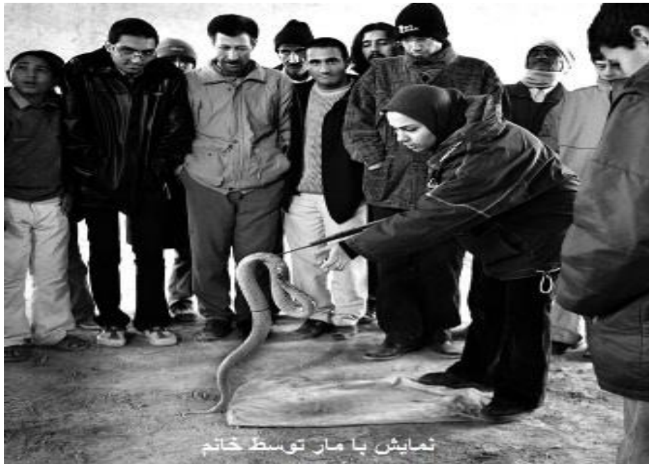
نمایش با مار توسط خاتم