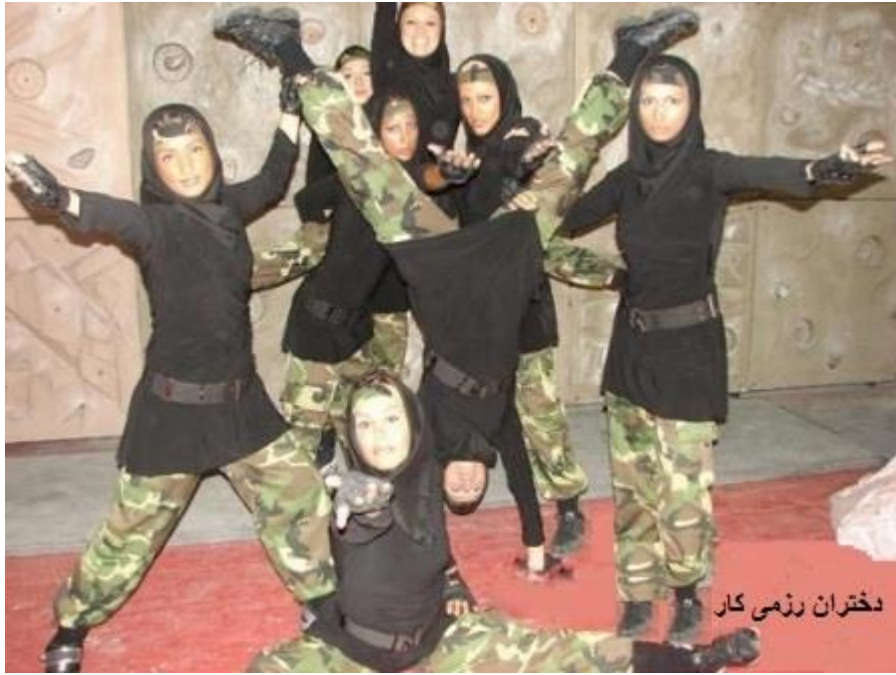
دختران رزمی کار