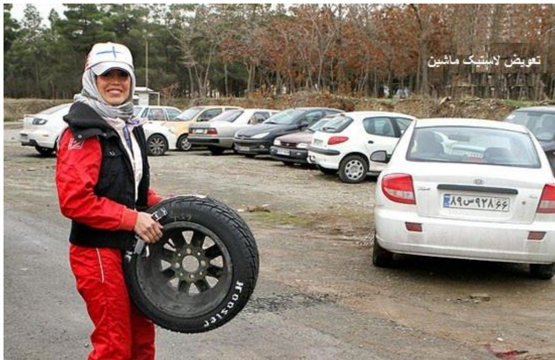
تعویض لاستیک ماشین