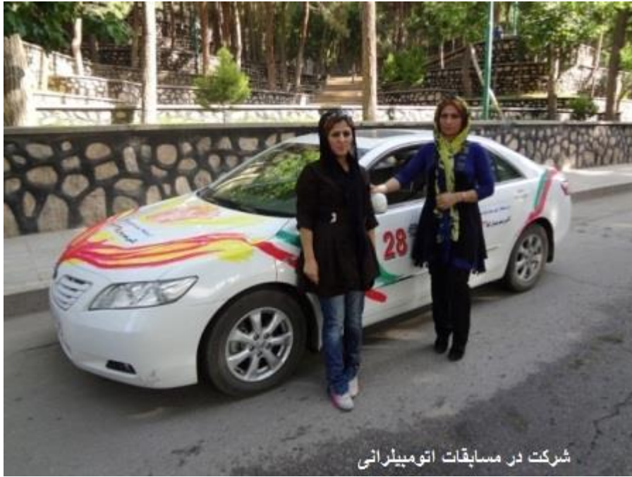
شرکت در مسابقات اتومبیلرانی